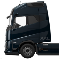
Cabina Globetrotter XXL