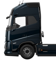
Cabina Globetrotter XL