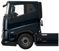
Cabina dormitorio con techo bajo